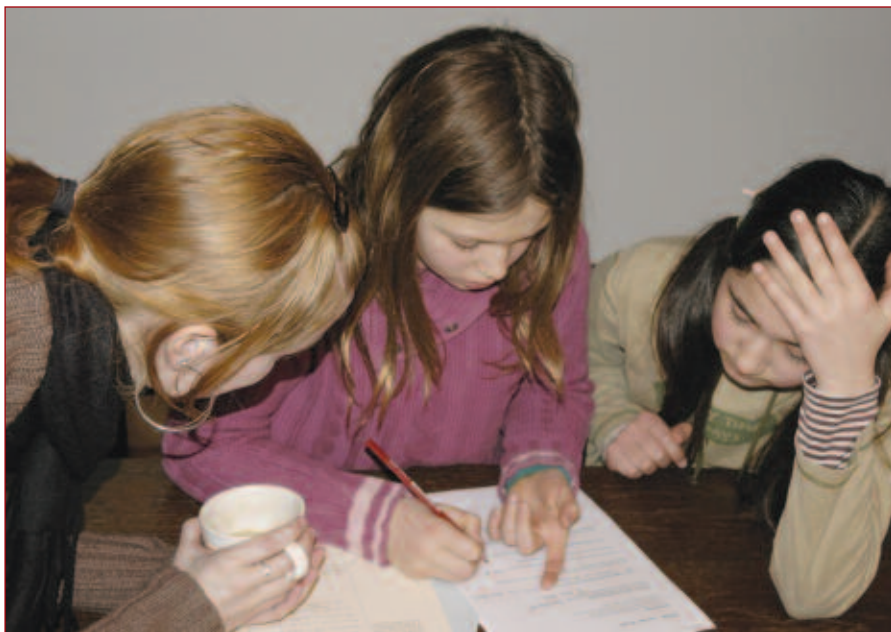
In kleine groepjes maken de leerlingen de opdrachten.

Wie wat bewaart, heeft wat! is een bijzonder project voor de leerlingen van de basisscholen van Haarlem en omstreken, opgezet door het samenwerkingsverband ErfgoedEducatie Haarlem. Het doel van het project is scholieren kennis te laten maken met de erfgoedinstellingen van Haarlem, hun interesse op te wekken voor het verleden en hen bewust te maken van het belang van het bewaren van het verleden voor de toekomst.