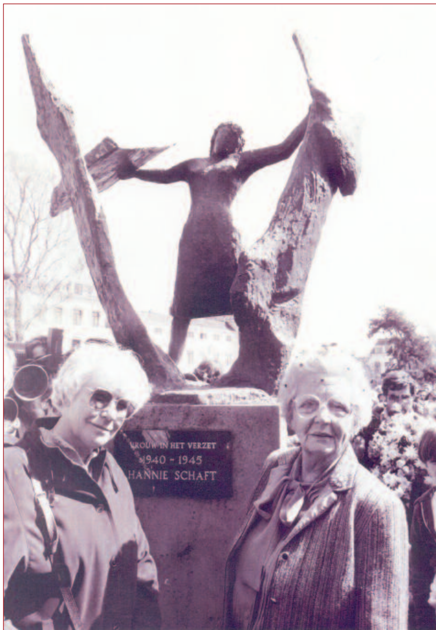
Truus Menger en prinses Juliana bij het Hannie Schaftmonument in het Kenaupark in Haarlem.

Truus Menger is nog steeds actief. In 2001 werd in de tuin van Herinneringscentrum Kamp Westerbork het monument Bevroren tranen van haar hand onthuld. In 2006 maakte zij in opdracht van dit herinneringscentrum een beeld ter nagedachtenis van de slachtoffers van Srebrenica, getiteld Vrouwen van Srebrenica .