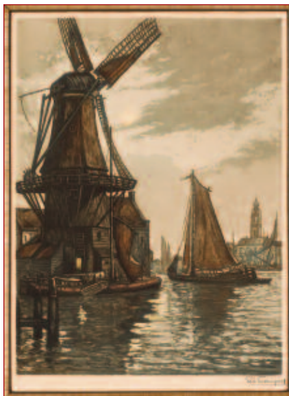
Molen de Adriaan, getekend door Georges François.

Ik begin te bemerken dat er in Haarlem een soort 'Adriaan-moeheid' aan het ontstaan is,