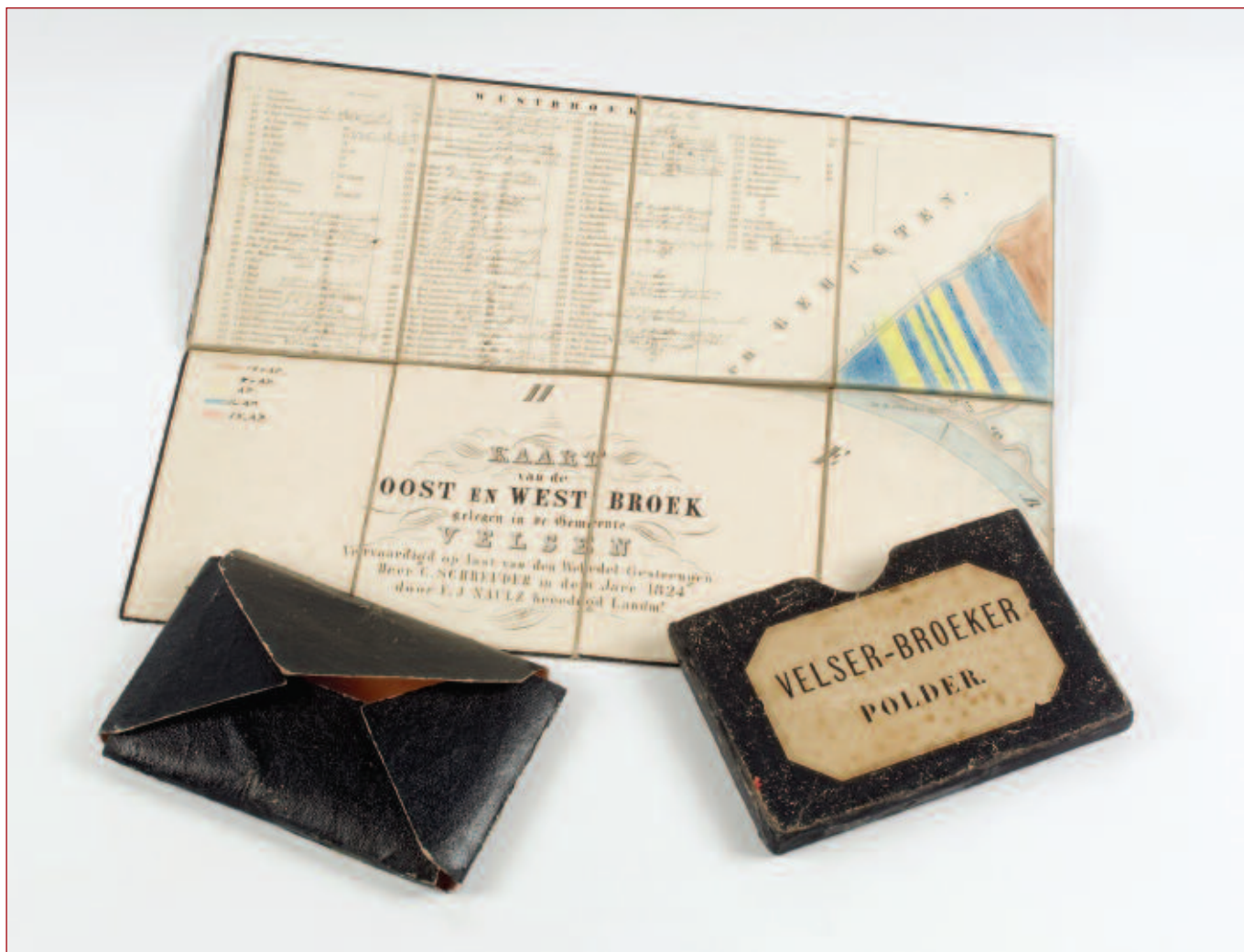
De kaart van de Velsersbroek, met enveloppe en foedraal, nadat deze zijn gerestaureerd door Marjolein Jongert, conserveringsadviseur van het Noord-Hollands Archief.

omvat). Ook wordt in de kaart de perceelnummering van de minuutplans weergegeven. De percelen op de kaart zijn later met verschillende kleuren ingekleurd naar de hoogte van de percelen ten opzichte van het Amsterdams Peil (AP). In de percelen wordt