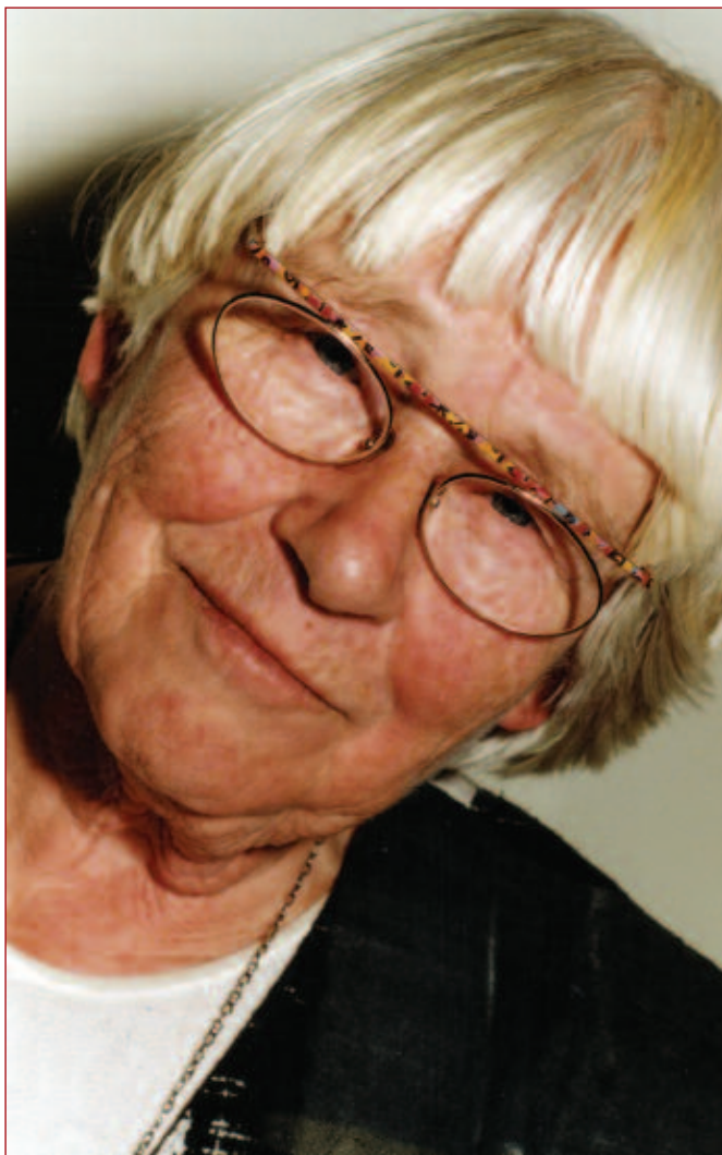
Truus Menger Oversteegen.