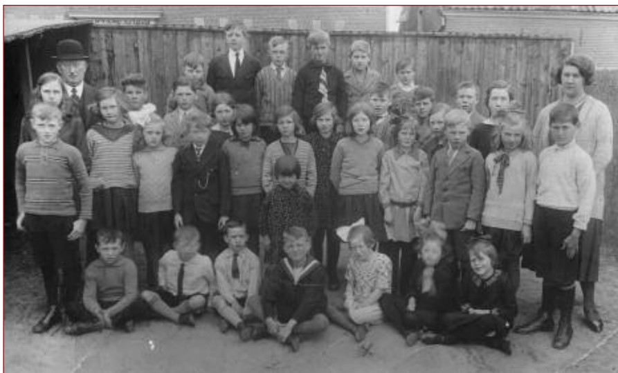
Klassenfoto met Truus Oversteegen (vooraan in het midden, met een strik in het haar). De school was gehuisvest aan de Linschotenstraat in Haarlem en heet nu Hannie Schaftschool.

Truus Menger-Oversteegen en haar zusje Freddie Oversteegen werkten de laatste twee jaren van de Tweede Wereldoorlog als Haarlemse verzetsstrijdsters nauw samen met Hannie Schaft. De zusjes Oversteegen overleefden de oorlog. Hannie Schaft werd door de Duitsers opgepakt en gefusilleerd. Zij werd bekend als 'het meisje met het rode haar'. De namen van Truus en Freddie Oversteegen zijn veel minder bekend.